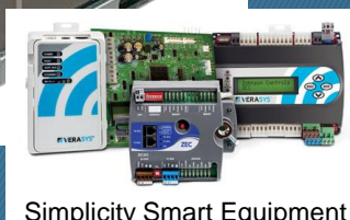
Simplicity Smart Equipment