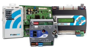
Simplicity Smart Equipment