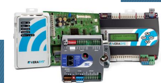
Simplicity Smart Equipment