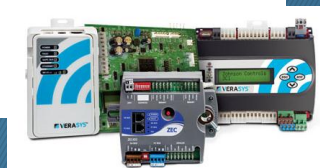
Simplicity Smart Equipment