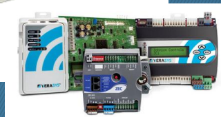
Simplicity Smart Equipment