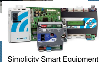
Simplicity Smart Equipment