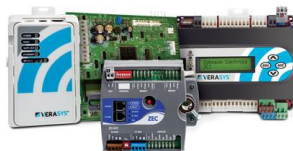
Simplicity Smart Equipment